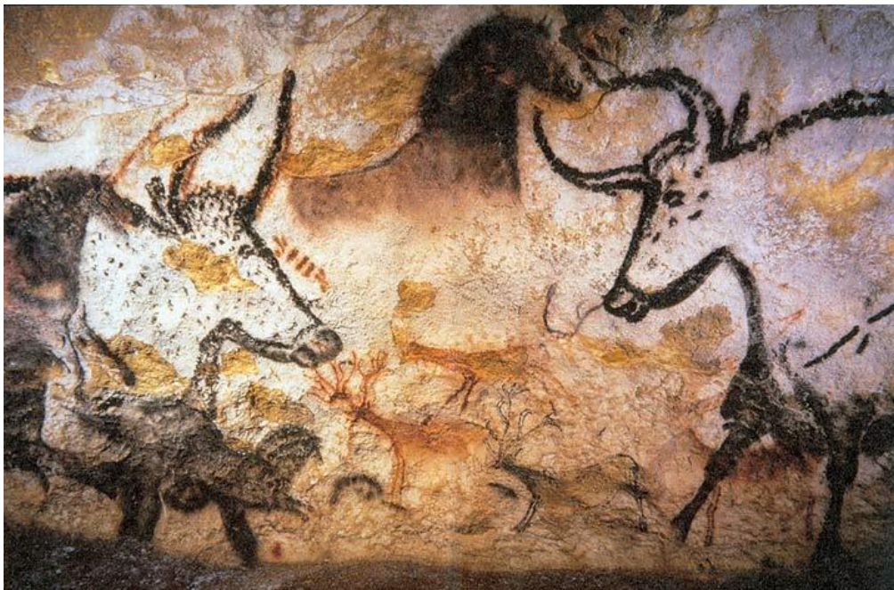
Représentation d'aurochs dans la grotte de Lascaux